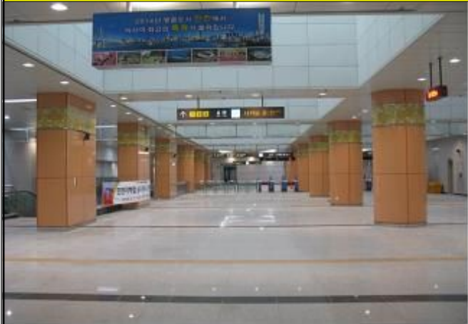
센트럴파크역 대합실 전경