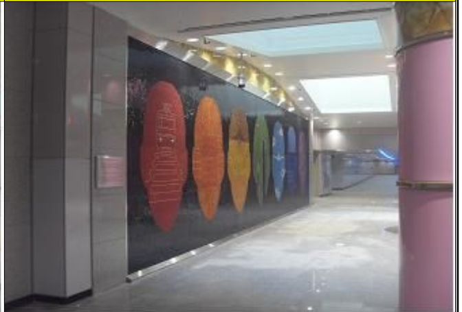
테크노파크역 대합실 벽면