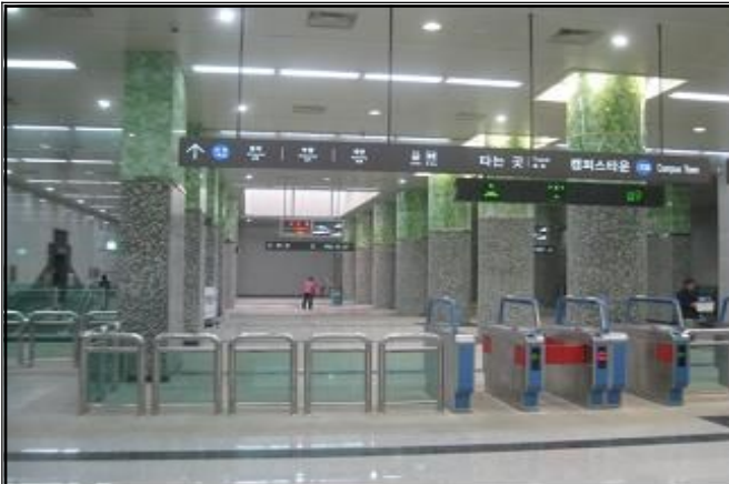
캠퍼스타운역 대합실 전경