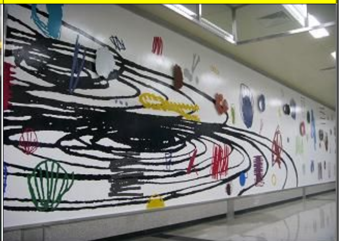
국제업무지구역 작품명: 채움, 묶기, 넓히기