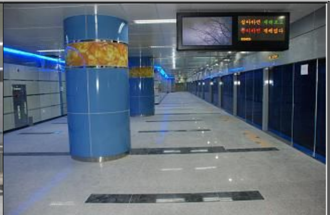
지식정보단지역 승강장 전경